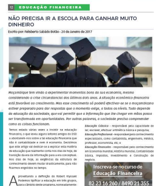
Agosto de 2017

Divulgação de Newsletter com artigos financeiros.